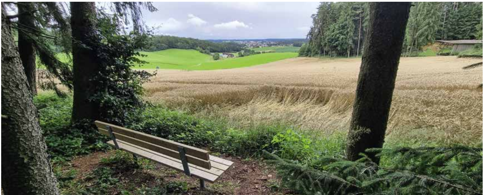
Das Hecht-Bänkchen beim Köhlhof in Sulzbach steht direkt am Waldrand und bietet einen traumhaften Blick Richtung Sulzbach.