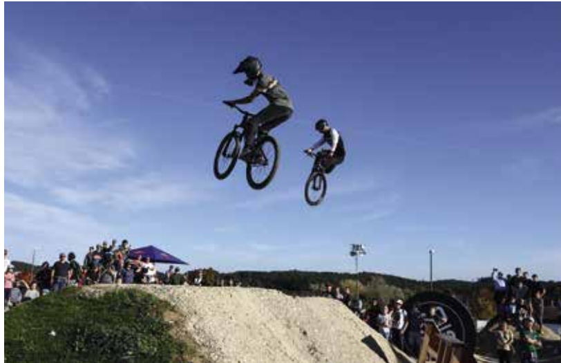
Der etwa 1.800 Quadratmeter große Dirt Park an der Ledererstraße

Insgesamt gibt es neun Bolzplätze in Pfaffenhofen und den Ortsteilen. Das DFB-Minispielplatz beim Eisstadion ist bei Kindern und Jugendlichen besonders beliebt. Für jüngere Kinder gibt es 38 Kinderspielplätze, darunter ein Abenteuerspielplatz in Niederscheyern. Alle Bolz- und Spielplätze findet man unter: www.pfaffenhofen.de/kinnerspielplaetze-und-bolzplaetze