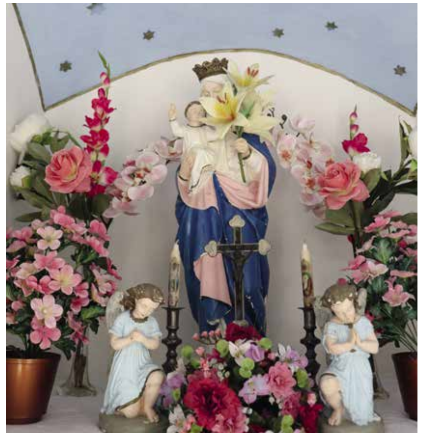
Die Figur der Gottesmutter mit Kind im Inneren dieser Wegkapelle an der Gemeindegrenze zu Pörnbach ist ganz von Blumen umrahmt.