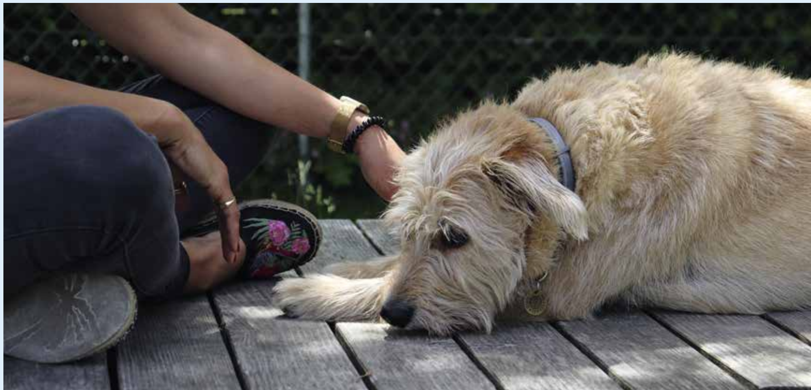
Die Sommerhitze kann auch den Pfaffenhofener Vierbeinern zu schaffen machen. Da bietet sich mittags eine ausgiebige Siesta im Schatten der Bäume im Bürgerpark an.