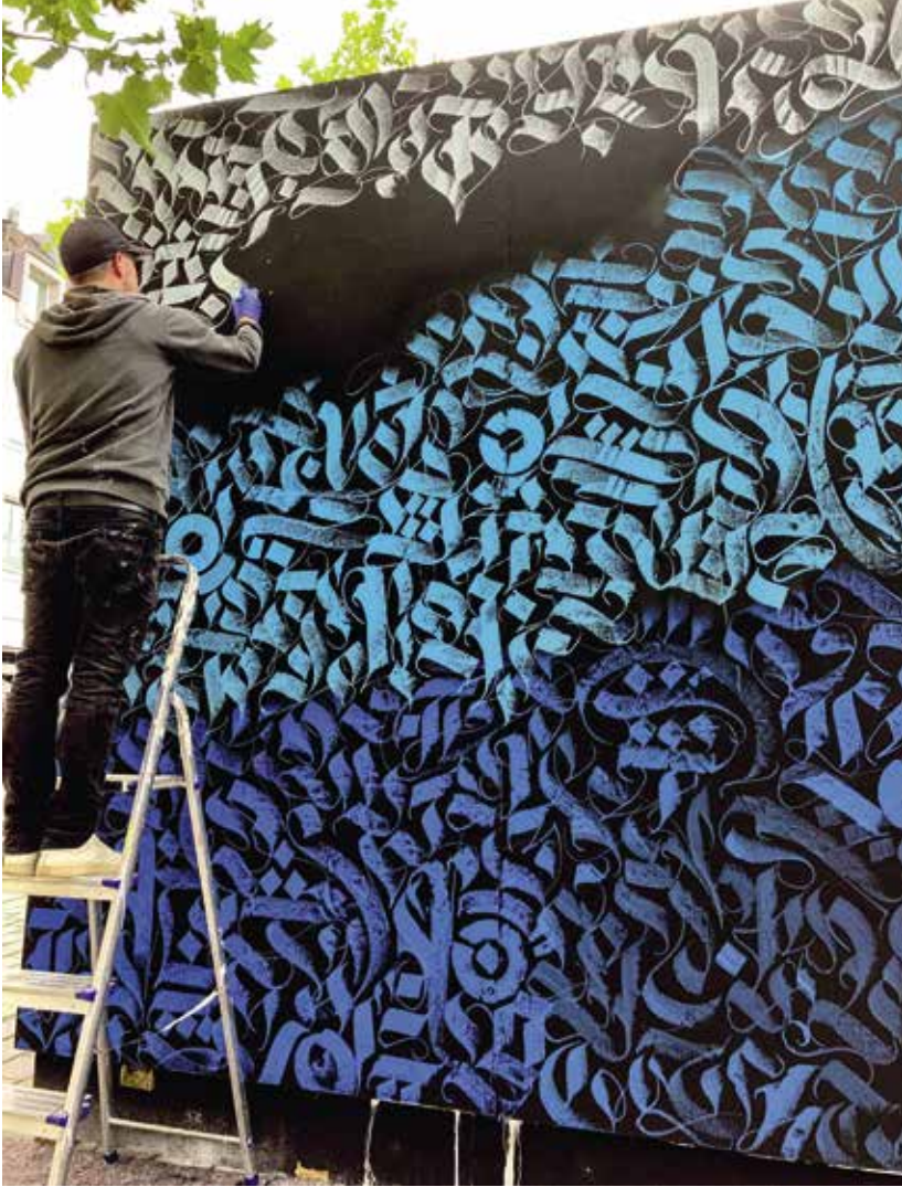
Patrick Hartl bei der Gestaltung des Urban-Art-Würfels auf dem Hauptplatz

Ein wichtiger Bestandteil des Kultursommers ist seit jeher die Bildende Kunst. In diesem Rahmen veranstaltet das städtische Sachgebiet Kultur mehrere Kunstaktionen am Hauptplatz. Eine davon ist der Urban-Art-Würfel, ein temporäres Kunst-Objekt, das bis zum 5. September in mehreren Aktionen mit unterschiedlichen Motiven bemalt wird. Künstler aus München und Erding gestalten auf Einladung des Pfaffenhofener Künstlers Patrick Hartl das Objekt mit ihm gemeinsam.