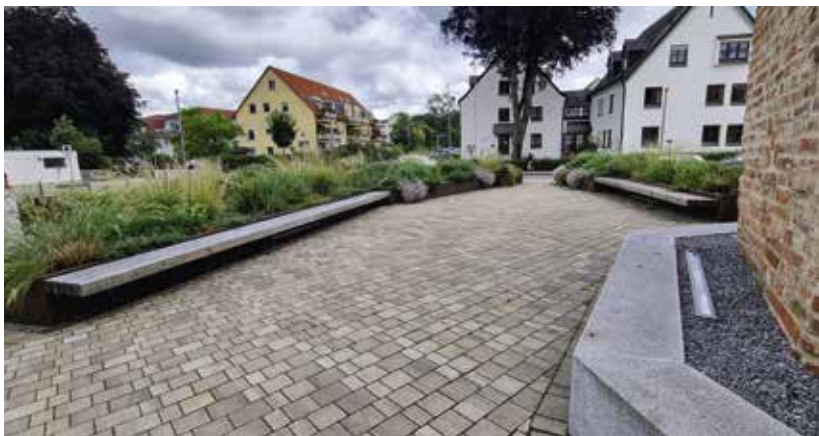
Die Ruhebänke am Hungerturm zwischen den bunten Staudenpflanzungen werden nicht von Bäumen beschattet, sondern teils vom 600 Jahre alten Hungerturm selbst.