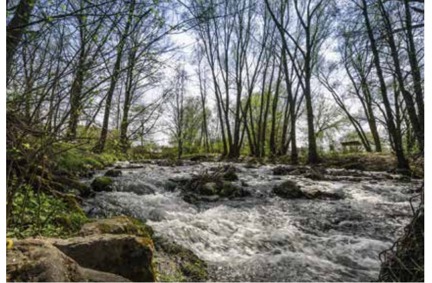
Für längere Ausflüge bieten sich die drei Panoramawege im Norden, Osten und Westen der Stadt an.