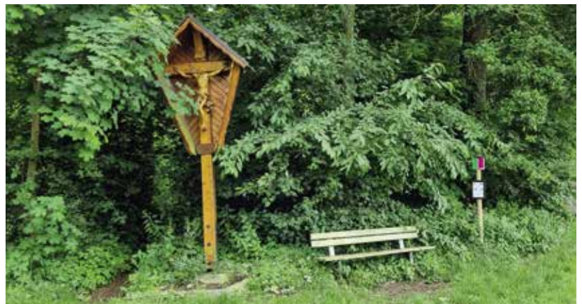
Das Bänkchen am Schleiferholz in Sulzbach steht direkt neben einem Marterl.