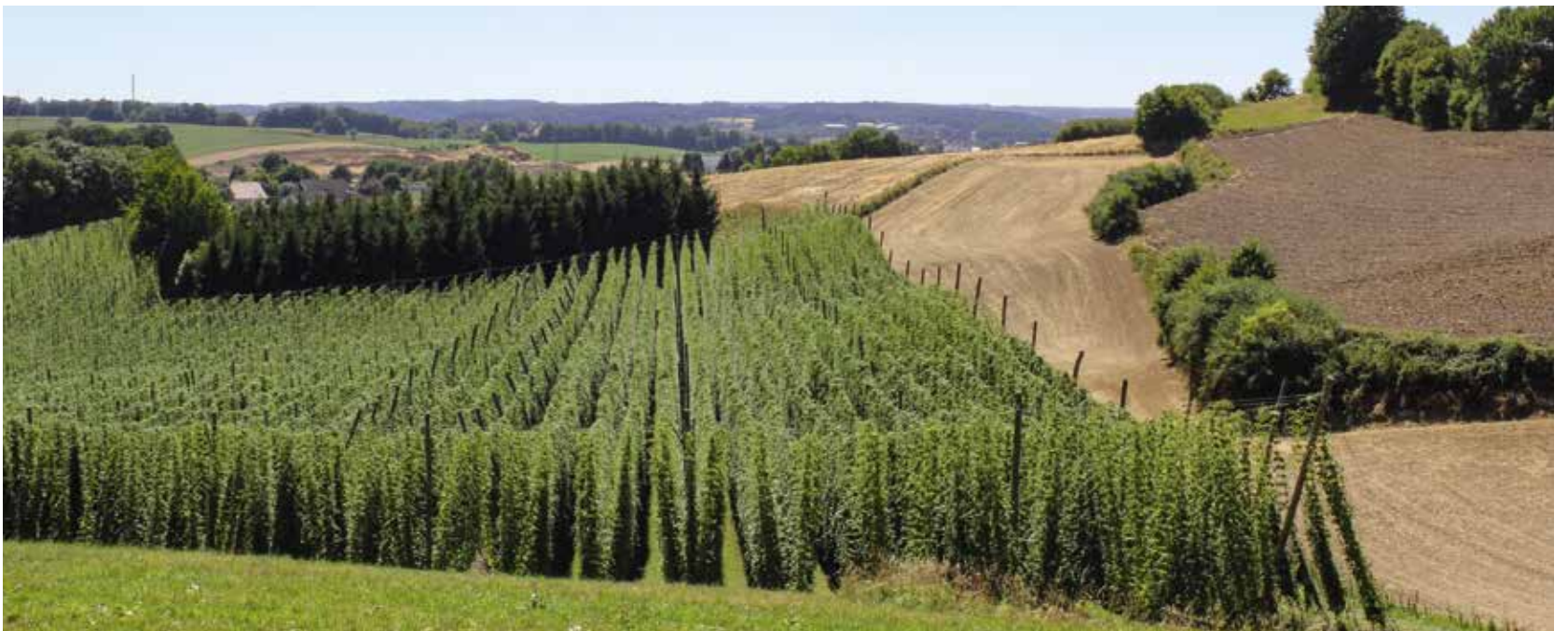
Die Hopfenfelder der Hallertau bieten Spaziergängern und Wanderern eine einzigartige Kulisse.