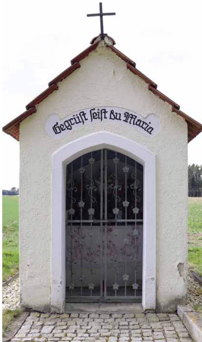
Diese Wegkapelle aus dem 19. Jahrhundert befindet sich an der Gemeindegrenze zu Pörnbach in der Nähe der Waldabteilung „auf der Stiang“.