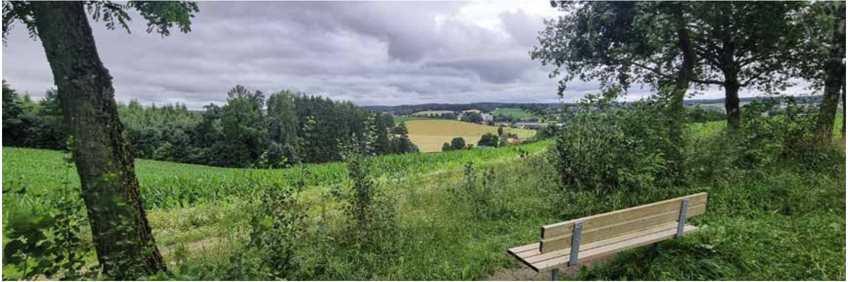
Das Bänkchen beim Hochbehälter in den Pfaffelleiten bietet einen wunderschönen Blick über die Felder.