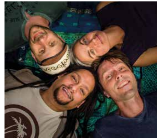
Baiser Salé

ab 13 Uhr (Konzertbeginn: 14.00 Uhr), bietet die Arbeiterwohlfahrt Pfaffenhofen zusammen mit dem MetalCrew Kultur e.V. und dem Veranstaltungsverein Oroboros in Kooperation mit der Stadt Pfaffenhofen den Besucherinnen und Besuchern im Freibad ein genreübergreifendes Musik- und Unterhaltungsprogramm, das sich mit 18 Bands und Acts – von Blues bis Metal – auf zwei Bühnen nebst anderen Attraktionen reichlich sehen lassen kann.