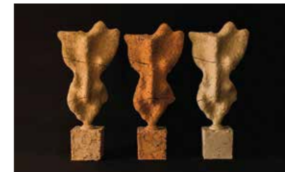
Petar Koši, Untitled (© Petar Koši)

Wahrnehmung auf die Suche nach Gegenseitigkeit der Idee und ihrer Materialisierung. Es ist die Rede von abstrakten, dynamischen Formen, Spielen von reinem Volumen ohne Mimese,