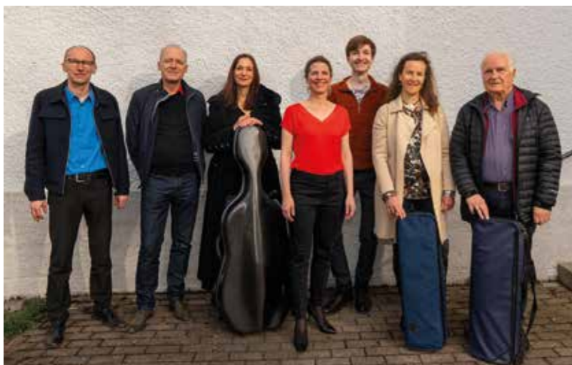
Das Ensemble Phoenix