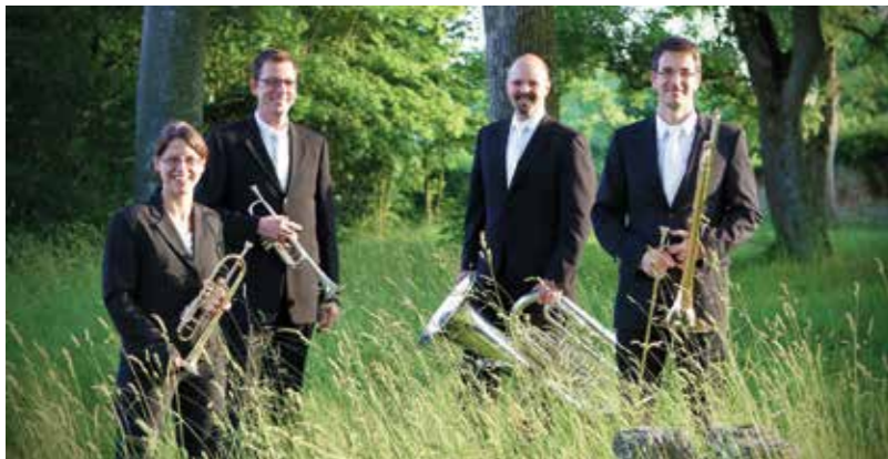
Das Blechbläserquartett quattro stagioni