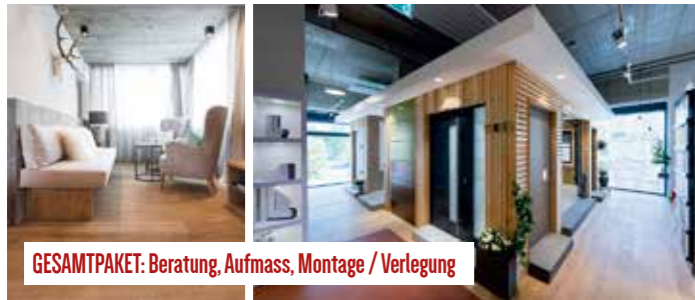
GESAMTPAKET: Beratung, Aufmass, Montage / Verlegung

Deshalb bieten wir Ihnen eine große Auswahl an Parkett und sonstigen Bodenbelägen um keine Wünsche offen zu lassen. Da auch die richtigen Fenster und Türen maßgeblich das gesamte Erscheinungsbild Ihres Hauses beeinflussen, haben wir nur Produkte die sowohl mit ihrer Optik als auch durch Sicherheit und optimale Dämmung überzeugen. Eine große Auswahl an Hand- oder Elektrowerkzeugen finden Sie in unserem Profi-Werkzeugfachmarkt. Kommen Sie bei uns vorbei, gemeinsam finden wir passende Lösungen für jedes Bauvorhaben. Unsere Verkaufsberater freuen sich auf Ihren Besuch!