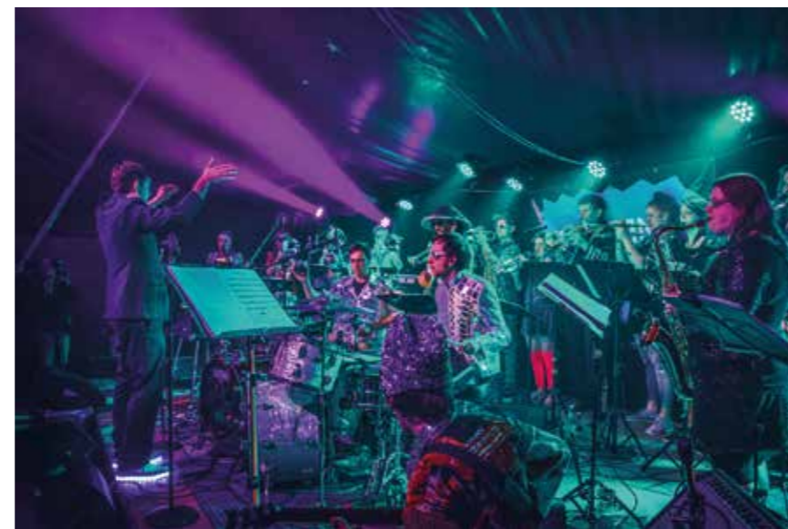
Das 25-köpfige „MassivJazzTechno-Ensemble“ der Bigband Dachau