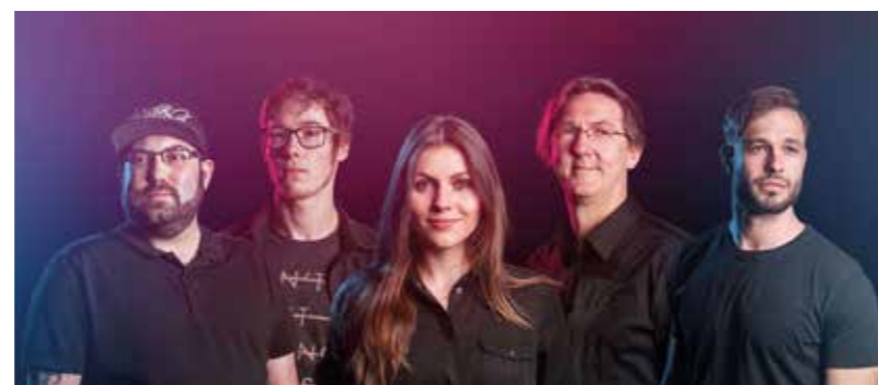
The Enfy's

Es gibt ja so einige neue Events im diesjährigen Super-Kultursommer. Und da dürfte wohl das zweitägige Musikfestival „Open Park PFA'HOFA“ im Ilmbad als einer der Höhepunkte auch weit über die Stadtgrenzen hinaus für Aufmerksamkeit und entsprechenden Besucherandrang sorgen. Am Samstag und Sonntag, 9. und 10. Juli, jeweils