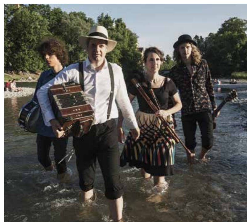
Freche, bayerische Tanzmusik in unkonventioneller Besetzung: Spui'maNovas – Donnerstag, 14. Juli, Bürgerpark

Donnerstag, 21. Juli, 19.30 Uhr, Bürgerpark 3. Picknick-Konzert: Salome Fur / Kraut & Ruhm