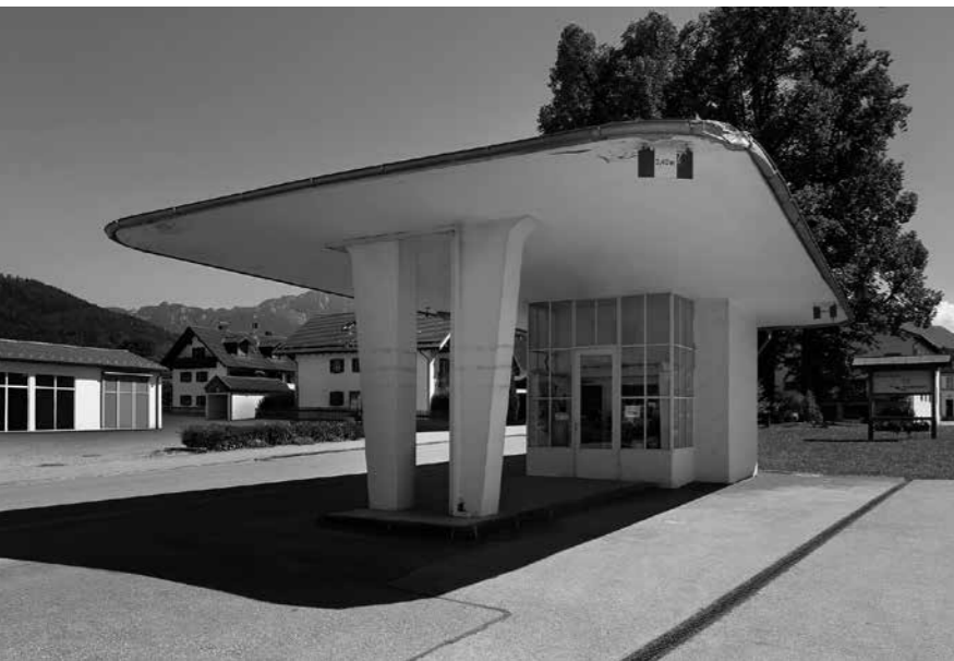
Tankstelle Benediktbeuern

Kunsthalle: Fotografische Reise zur klassischen Moderne mit Architekturfotografien von Jean Molitor