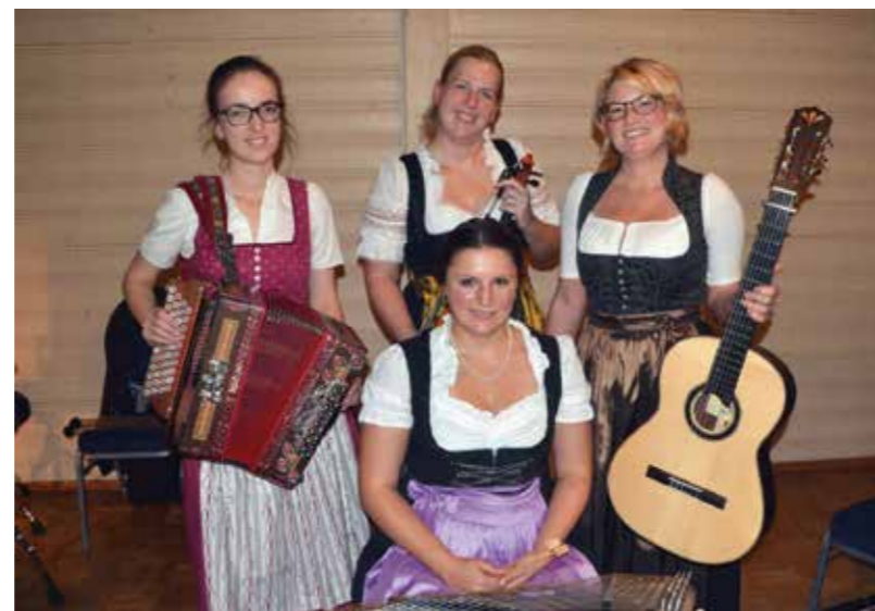
Oberstimmer Hoagartn Musi