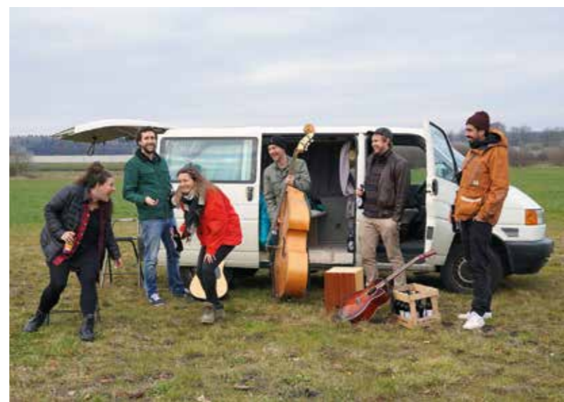
Zwischen Gesellschaftskritik und der Freude am Sein: Kraut & Ruhm – Donnerstag, 21. Juli, Bürgerpark

Direkt nach ihrem gemeinsamen Auftritt im Bürgerpark letzten Sommer stand fest: Das wollen wir nochmal machen! Die beiden Bands,