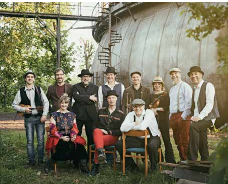
Folk-Punk-Orchestra von der Größe einer Fußballmannschaft: Revelling Crooks – Donnerstag, 7. Juli, Bürgerpark

Seit 25 Jahren spielen die Revelling Crooks ein legendäres Mashup aus Balkan-Klezmer-Punk, Irish-Folk-Polka, Italian-Partisan-Songs, Ska, Rock'n'Roll und Mariachi-Cumbia. Vogelwilder Offbeat trifft auf rauen Straßenchanson und Protestlied. Revelling Crooks – das ist schnelle Tanzmusik und Volkstanz-Punk. Auf der Bühne entzündet die elfköpfige Band ein wildes Feuerwerk an Lebensfreude. Mit ihrer ungestümen Spielfreude und einer bunten Mischung der unterschiedlichsten Folk-Wurzeln aus Ost- und Westeuropa sorgen sie für Stimmung und gute Laune. Das Folk-Punk-Orchestra von der Größe einer Fußballmannschaft möchte sich mit anarchischem Freigeist und der Attitüde des Punkrock in die Herzen des Publikums spielen. Also: Lasst sie hinein!