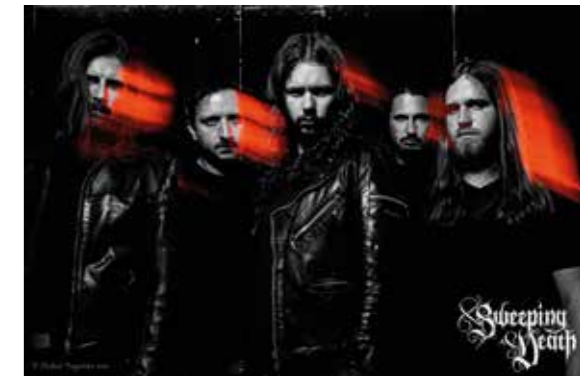
Sweeping Death

Als Bands und Acts sind unter anderem dabei: Sweeping Death, The Enfy's, Dunning Kruger, Die Stachelbären, Kaifeck, Flame or Redemption, Trapp & Appel, Baiser Salé und Sacrifice in Fire (Zeitplan siehe Extrakasten). Der Zugang zum Festival ist im regulären Eintrittspreis für das Ilmbad enthalten. Detaillierte Informationen zum Programm und den Bands sind zu finden unter www.open-park.de .