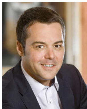
Ihr Thomas Herker Erster Bürgermeister