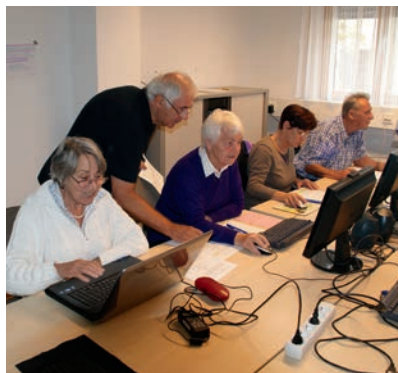
Der PC-Kurs ist ein Beispiel für das Motto „Von Senioren für Senioren“.