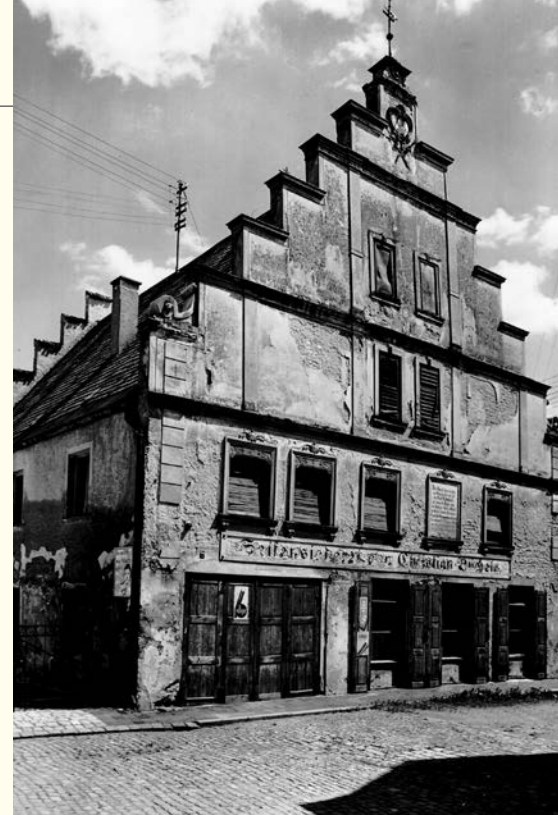
Das alte Heiliggeistspital an der heutigen Frauenstraße diente als erstes Gebäude der Stadt der Unterbringung und Versorgung älterer Menschen [1958].