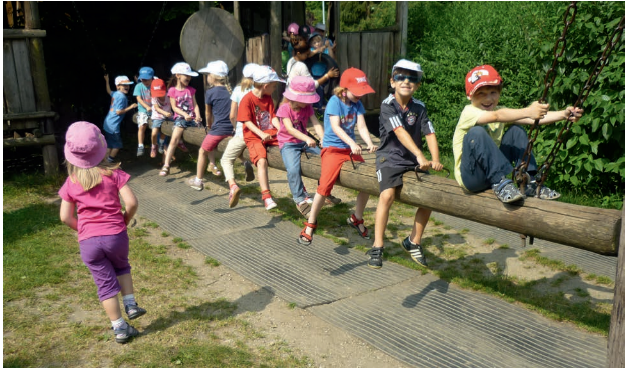
Eine gute Kinderbetreuung erleichtert jungen Familien den Spagat zwischen Beruf und Familie.

Familienfreundlichkeit stellt Pfaffenhofen auch mit seinem 1991 eingeführten Einheimischenmodell unter Beweis, das sich vor Ort bestens bewährt. So haben sich schon viele Pfaffenhofener Familien den Traum von den eigenen vier Wänden erfüllen können. Auch der Bayerische Gemeinde-