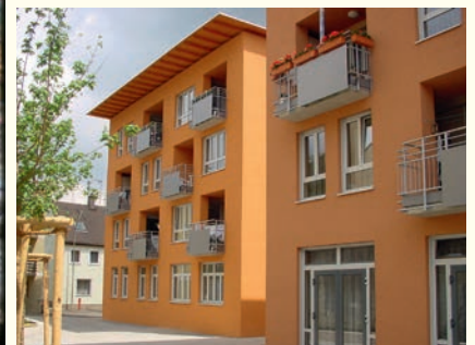
Oben links: An der Grabengasse befand sich in einem Teil des ursprünglichen Franziskanerklosters der erste Kindergarten Pfaffenhofens (um 1925). Großes Bild: Blick über den 1961 eröffneten Kindergarten am Schleiferberg kurz nach seiner Eröffnung. Oben rechts: Der Kindergarten am Schleiferberg im Jahr 1961 läutete die Reihe der Neubauten für derartige Einrichtungen ein. Unten rechts: Die Wohnanlage St. Josef am Hofberg bietet seinen Bewohnern einen würdigen Rahmen für das Leben im Alter.