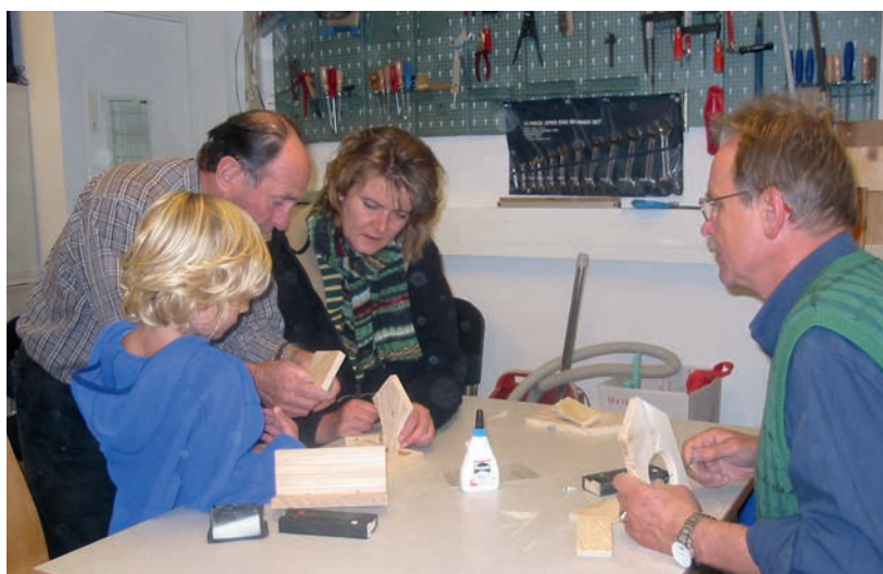
Die Generationen wieder näher zueinander zu führen und Raum für Begegnung zu schaffen ist das Motto der der Alt-Jung-Projekte, einer Kooperation des Mehrgenerationenhauses der Caritas und des Seniorenbüros.

Die Stadt Pfaffenhofen betreibt als Einrichtungen das Jugendzentrum, das Jugendkultur- und Medienzentrum und das Jugendbüro, um den ganzheitlichen Entwicklungen der Jugendlichen begegnen zu können. Die Jugendarbeit in Pfaffenhofen ist geprägt von verlässlicher Präsenz. Sie präsentiert sich bewusst vielfältig und schafft altersgerechte Gestaltungsräume.