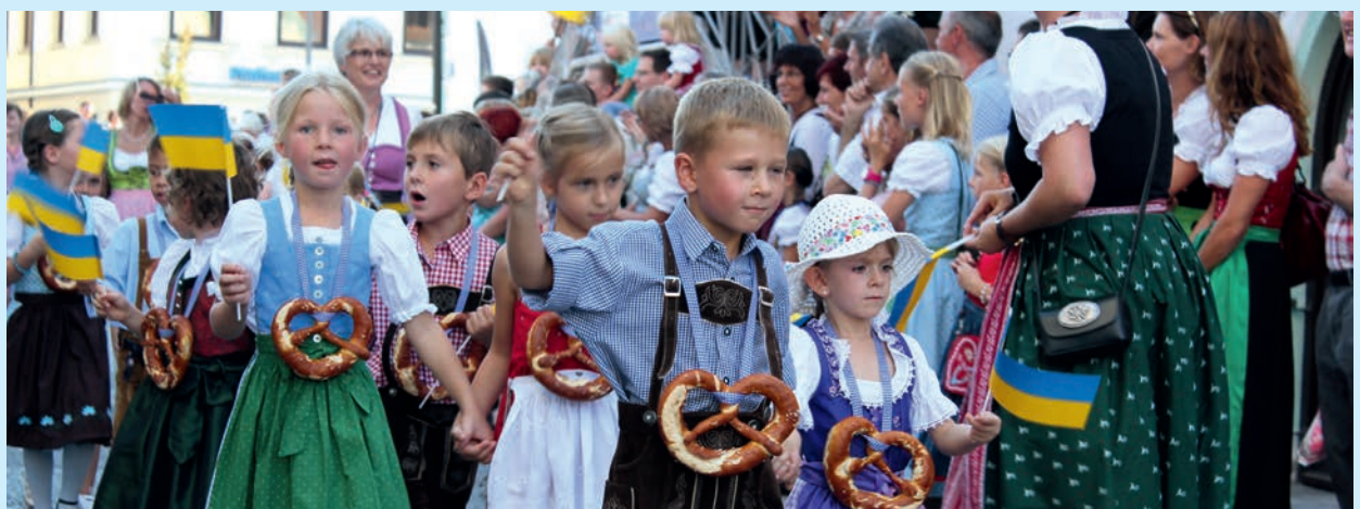
Voller Stolz nahmen auch viele Kindergartenkinder an dem prächtigen Festzug zur Eröffnung des diesjährigen Volksfestes teil.