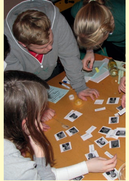
Jedes Jugendparlament entwickelt eine eigene Richtung.