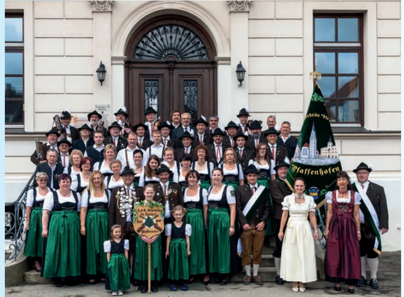
Die Mitglieder der ZSG Stegerbräu „die Ruaßigen“ Pfaffenhofen