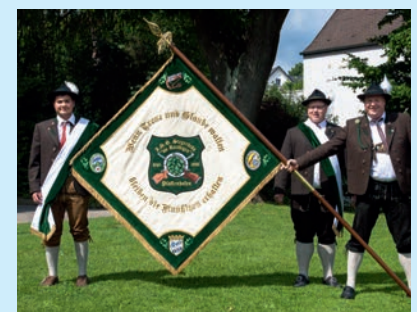
Stolz präsentieren die drei Fähnriche die Stadt- und Vereinsseite der neuen Fahne.