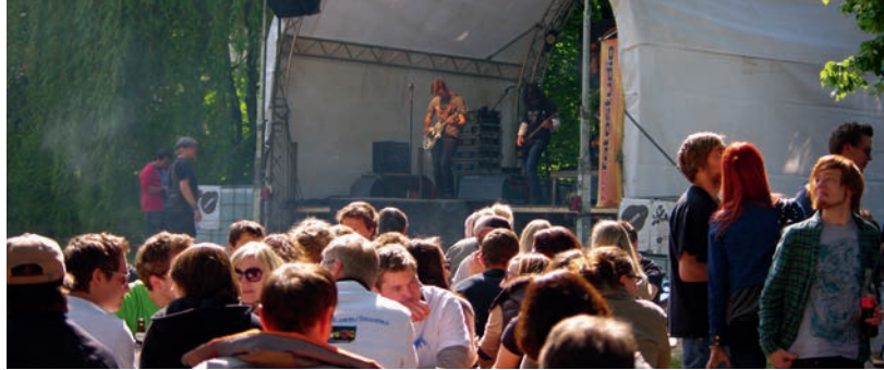
Alljährlich am Vatertag setzt die Stadtjugendpflege mit dem Saitensprung-Festival ein kulturelles Highlight für die Pfaffenhofener Jugendszene..

Ältere Menschen, die sich von ihrer großen Wohnung oder dem Haus mit Garten verabschieden wollen, finden in der Wohnanlage St. Josef zentral und seniorengerecht optimale Bedingungen. Sie können in den modernen Wohnungen im Herzen der Stadt bar-